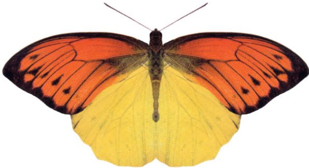
属 Hebomoia 種小名 leucippe 英名 / 和名 ヒイロツマベニ 分布 Ambon 開長 100mm 食草 ?