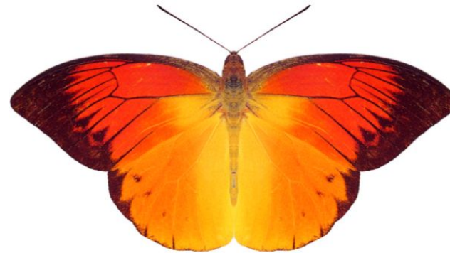
属 Hebomoia 種小名 leucippe 英名 / 和名 デタニツマベニ 分布 Celebesペレン島 開長 100mm 食草 ?

この属はシロチョウ科の中でもっとも大型で飛翔力大。♀は♂より大きく色彩も濃厚。幼虫はフウチョウボク属を食べる。東南アジアでは地域によって色彩が異なるものが生息。