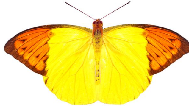
属 Hebomoia 種小名 glaucippe 英名 / 和名 キイロツマベニ 分布 Nias 開長 100mm 食草 ?